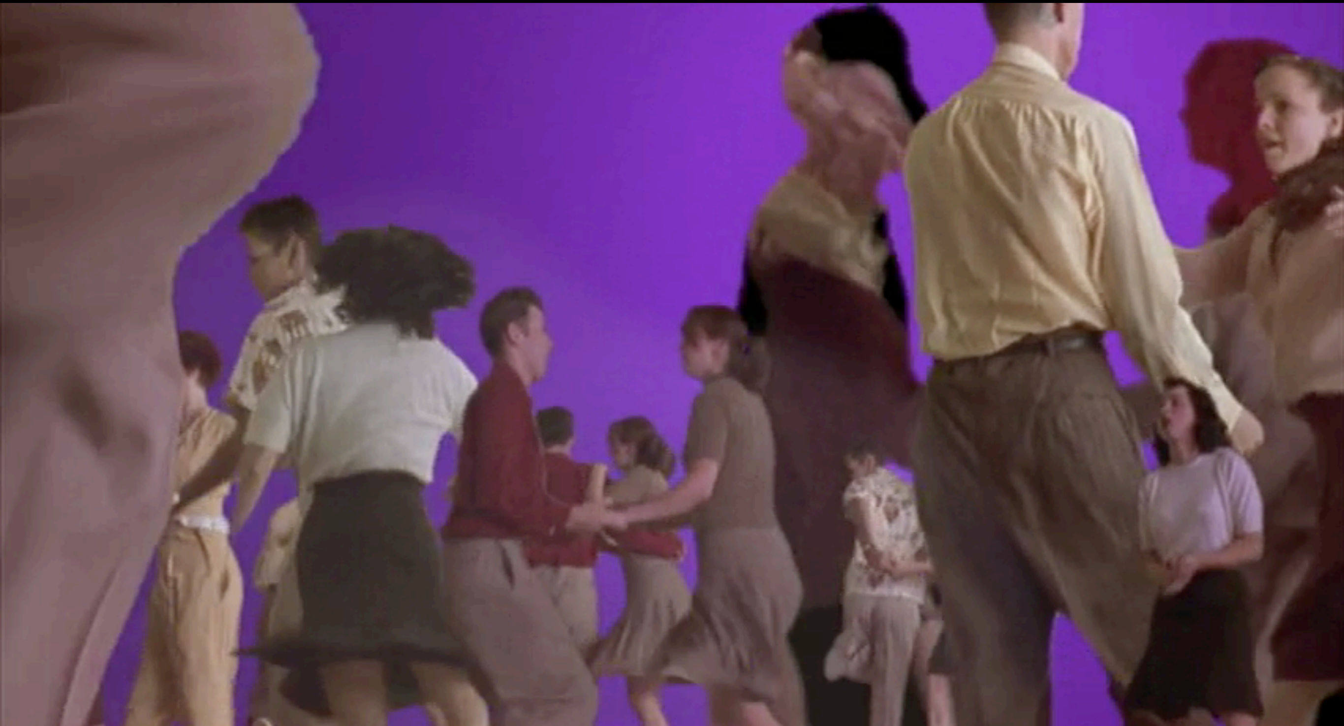
Mulholland Drive (Lynch, 2001)