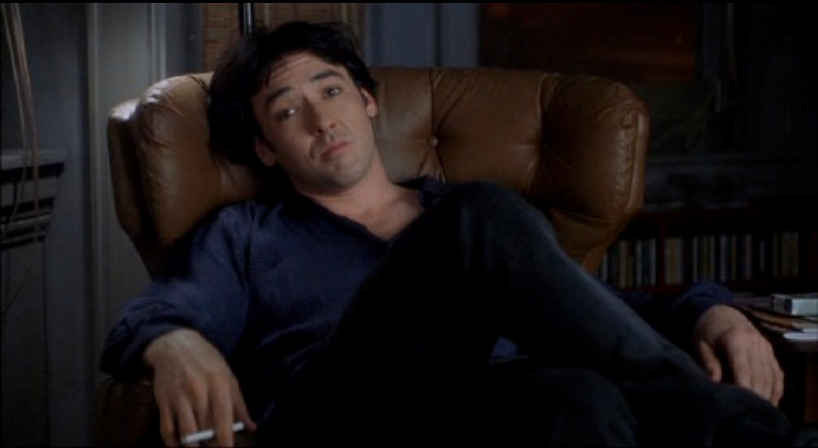
High Fidelity (Frears, 2000)