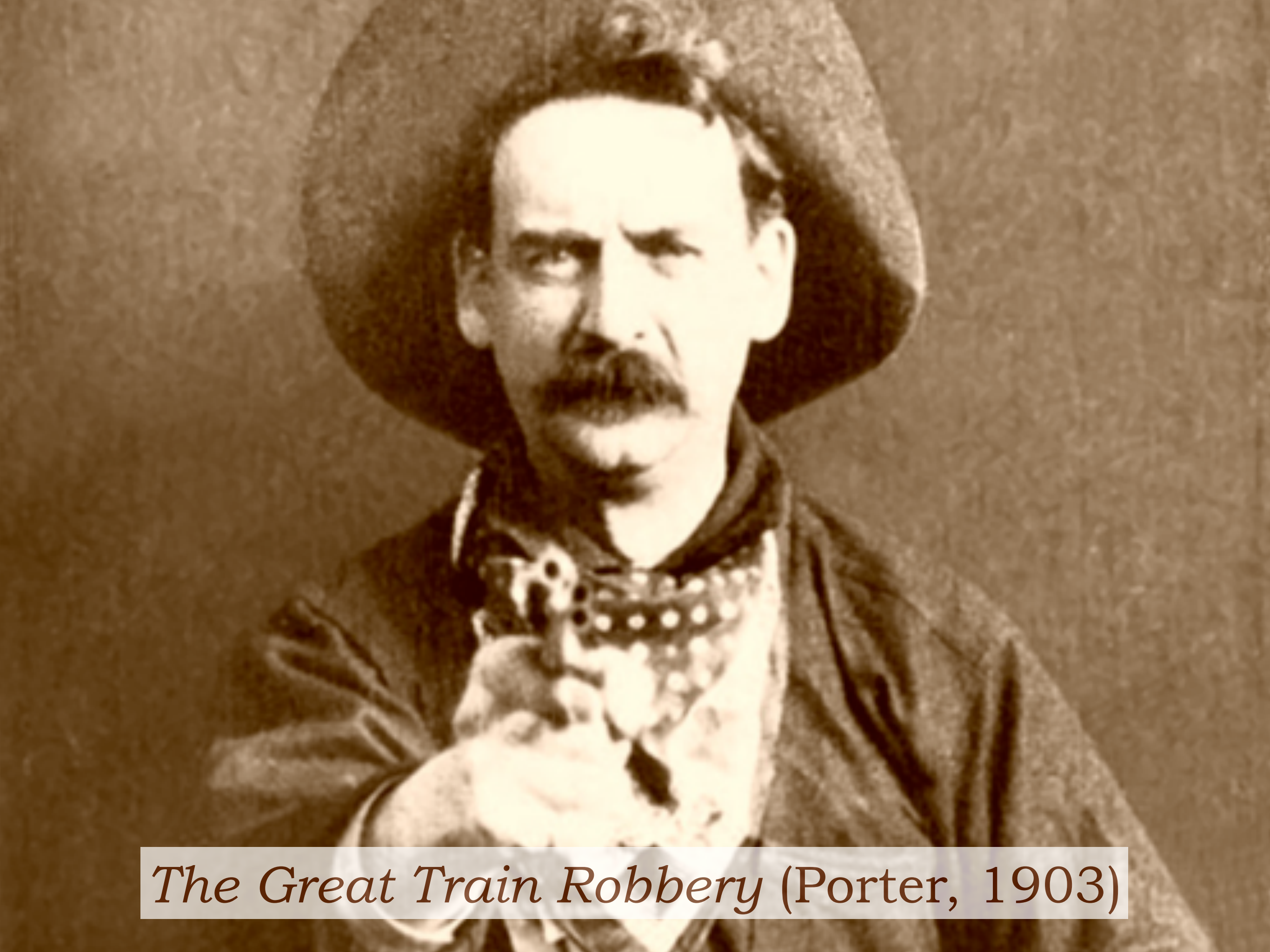
The Great Train Robbery (Porter, 1903)