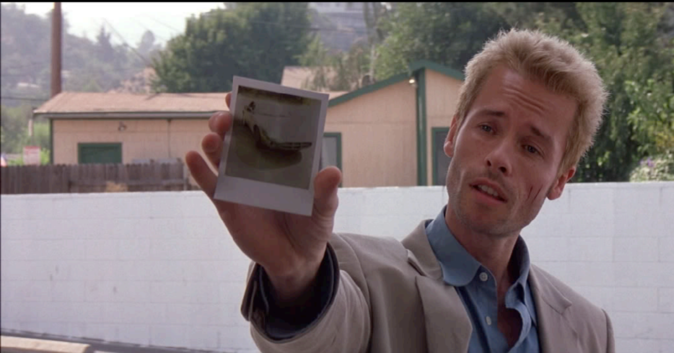
Memento (Nolan, 2000)